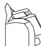
PROTECTOR DE TRONCO